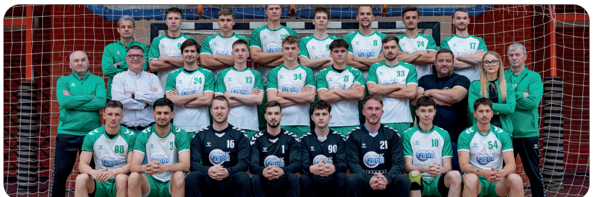
2025/26-os szezon NB II. Észak-Kelet (C–D) csoportjának ezüstérmese a Tiszavasvári SE férfi kézilabdacsapata.

Országos elismerésben részesült a Tiszavasvári Városi Televízió. A Savaria Országos Filmszemlén a „Tűz varázsa” című dokumentumfilm a Népművészet kategória 2. helyezését szerezte meg. A sikeréről és a díj háttéréről bővebben lapunk 4. oldalán olvashatnak.