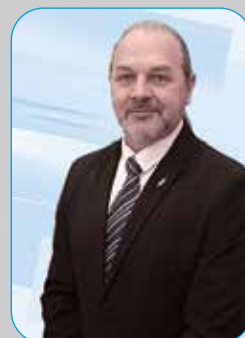
SZÓKE ZOLTÁN FIDESZ-KDNP