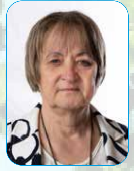
3.v.k.: VOLOSINÓCZKI BÉLÁNÉ VASVÁRI PÁL TÁRSASÁG