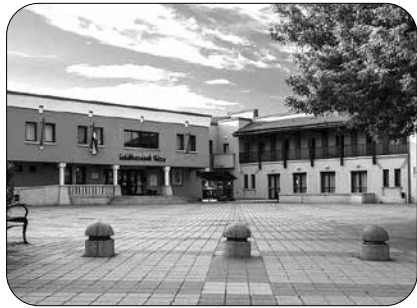
MEGÚJULHAT A VÁROSHÁZA TÉR PARKJA ÉS A KOSSUTH ÚT EGY RÉSEGE EGÉSZEN A VÁCI GIMNÁZIUMIG