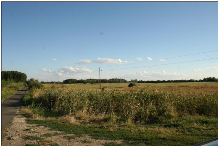
4. számú kép: A hasznosításra tervezett terület Északi irányból

A terület környezetében legelő gazdálkodás (állattartással) folyik évek óta tanyás rendszerben kis területeken 20 hektár alatt.