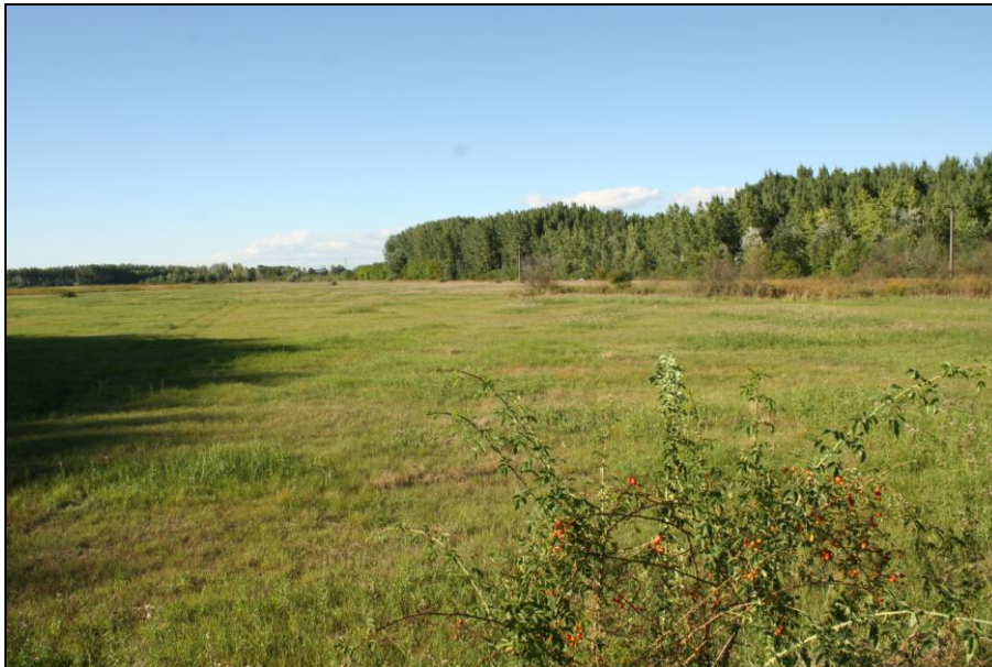
1. számú kép: A tervezés alatt álló terület Déli irányból a tervezett gazdasági telep területével

Terveik szerint 100 db szarvasmarhát, valamint 100 db sertést (mangalica) tartanának. Jelenleg az ehhez szükséges építész tervek, valamint a közművek elhelyezkedése pontos igénye nem ismert. A vállalkozás megvalósításával a környező 30 ha legelő területe hasznosíthatóvá válna ami jelenleg parlagon van.