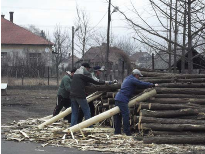
Faoszlopok háncsának leszedése