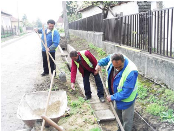
Árokburkolás a belvíz projekt keretében