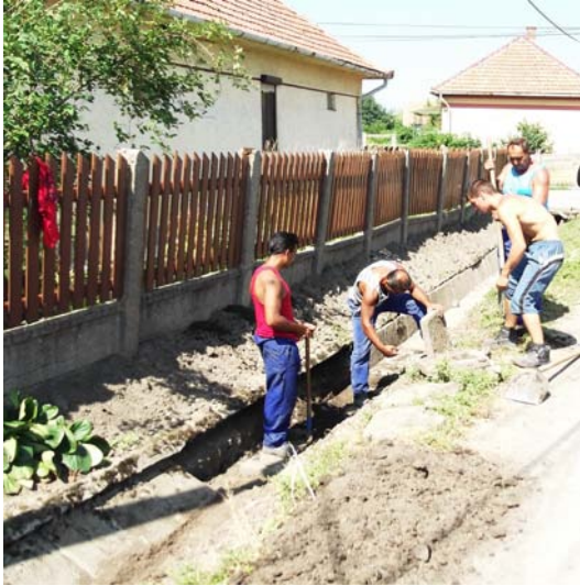
Árokfelújítás a Kisfaludy úton