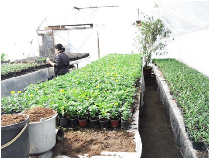
Virágpalánta nevelés 2.