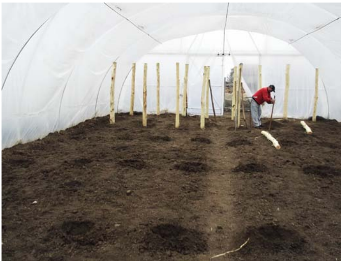
Támrendszer kialakítása a fóliában