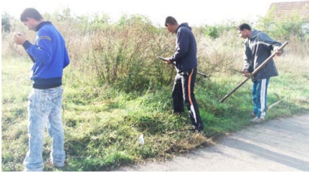
Kaszálás kézi kaszával a közút projekt keretében