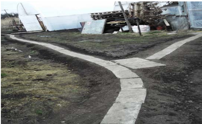
Járda kialakítása a fóliasátrak között

Ez a projektelem csupán két hónapos támogatottsági időszakot tett lehetővé, és 9 fő foglalkoztatását biztosította, de rendkívül nagy jelentősége volt a mezőgazdasági projekt előkészítési munkálataiban, valamint a tavaszi-nyári virágpalánták nevelésében.