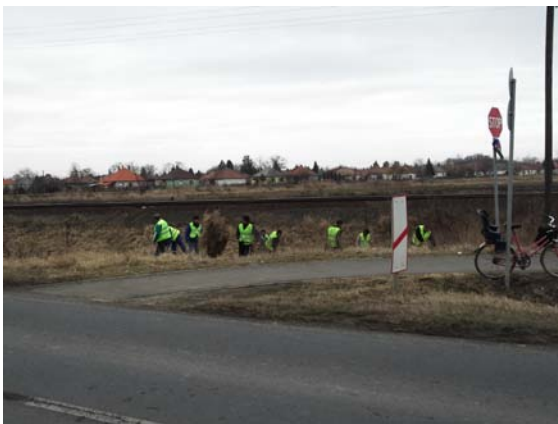
Kerékpárút melletti terület takarítása