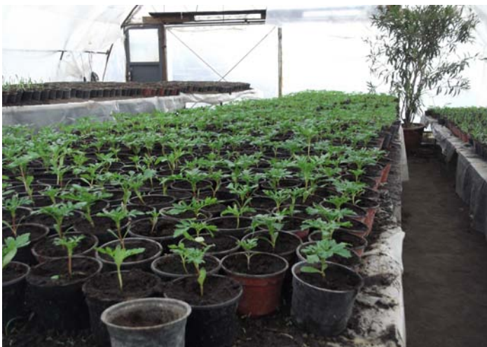
Virágpalánta nevelés 1.