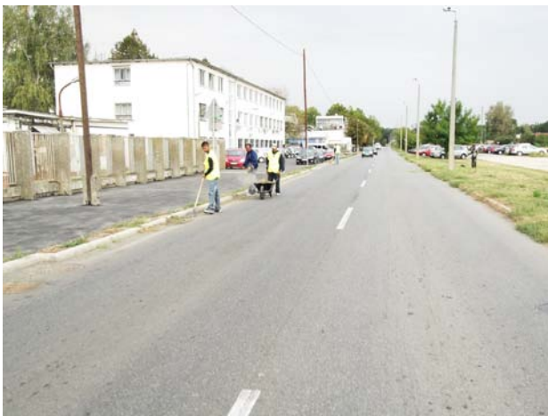
Útpadka takarítás, rendbetétel