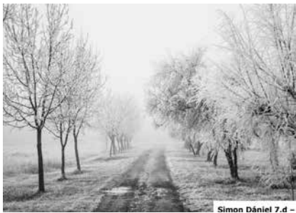
Simon Dániel 7.d –