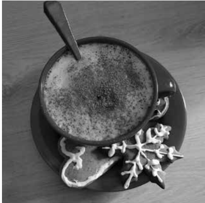
Gajdos Lilla 7.a – Forró csoki a hideg napokon

iskola.hu könyvtár menüpontja alatt megtalálhatjátok. Gratulálunk a „Télbe fordult...” díjazottainak! Jó fényeket, napsugaras vidám tavaszt és jó egészséget kívánunk mindenkinek.