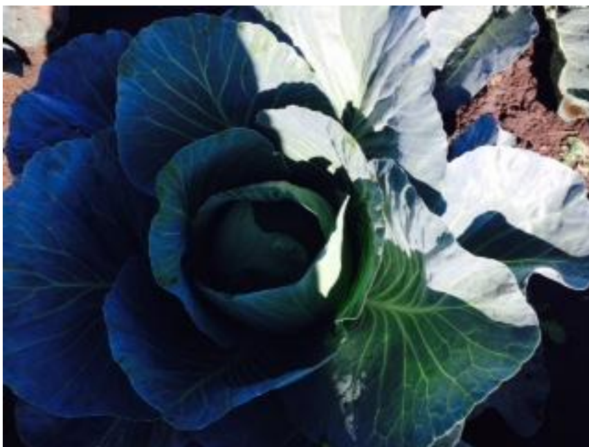
Szabadföldön termelt káposzta.