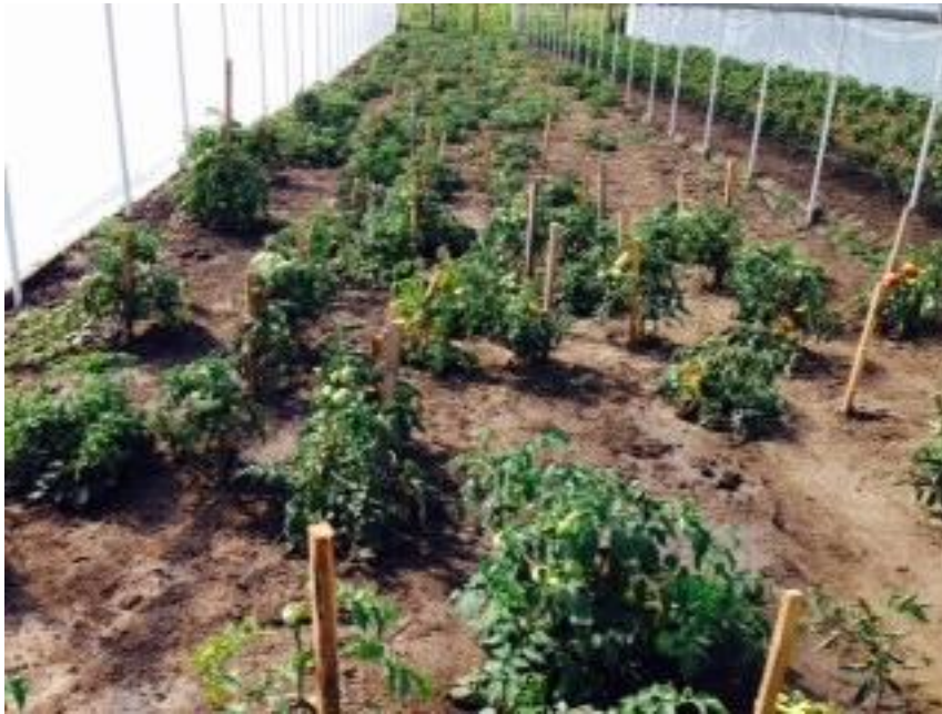
A vándor fóliasátorban paradicsom és paprikapalánták kerültek elültetésre.