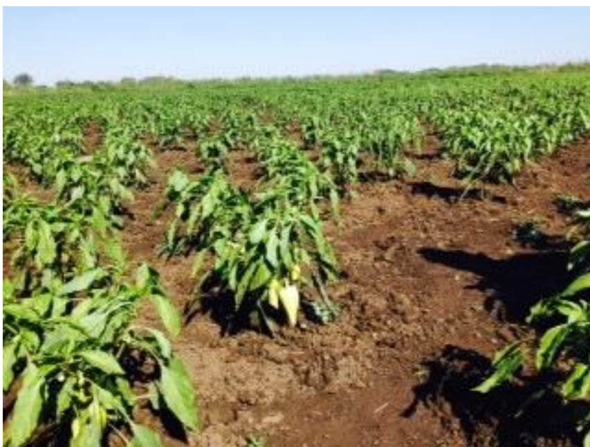
A szabadföldön termelt paprika.