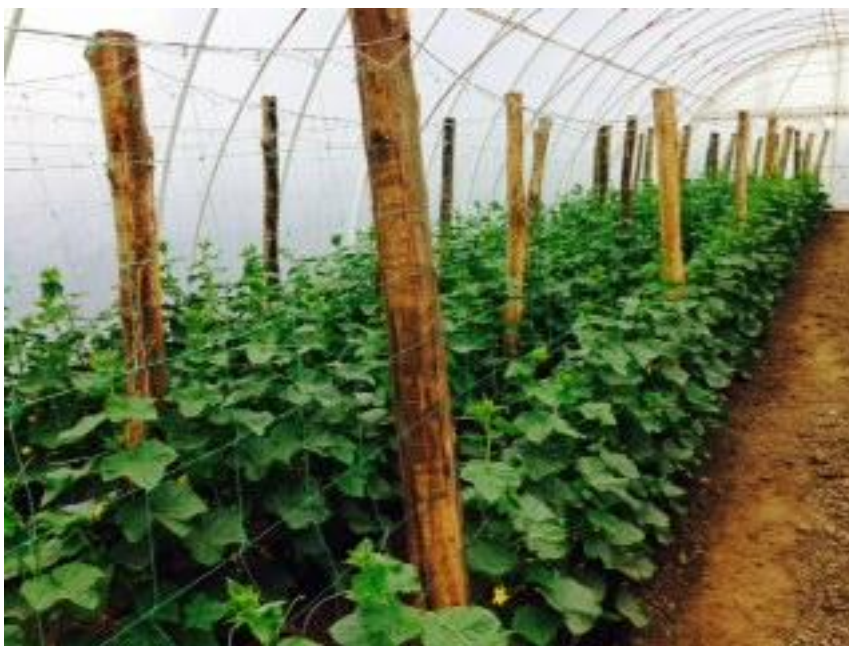
A fóliasátorban fürtös uborka és kígyóuborka került ültetésre.