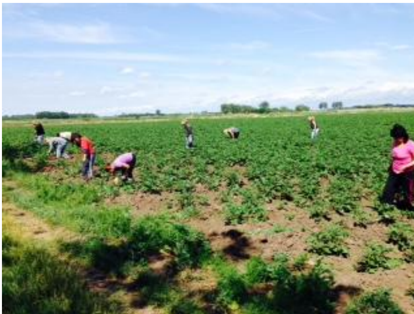
A szabadföldön elültetett burgonya.