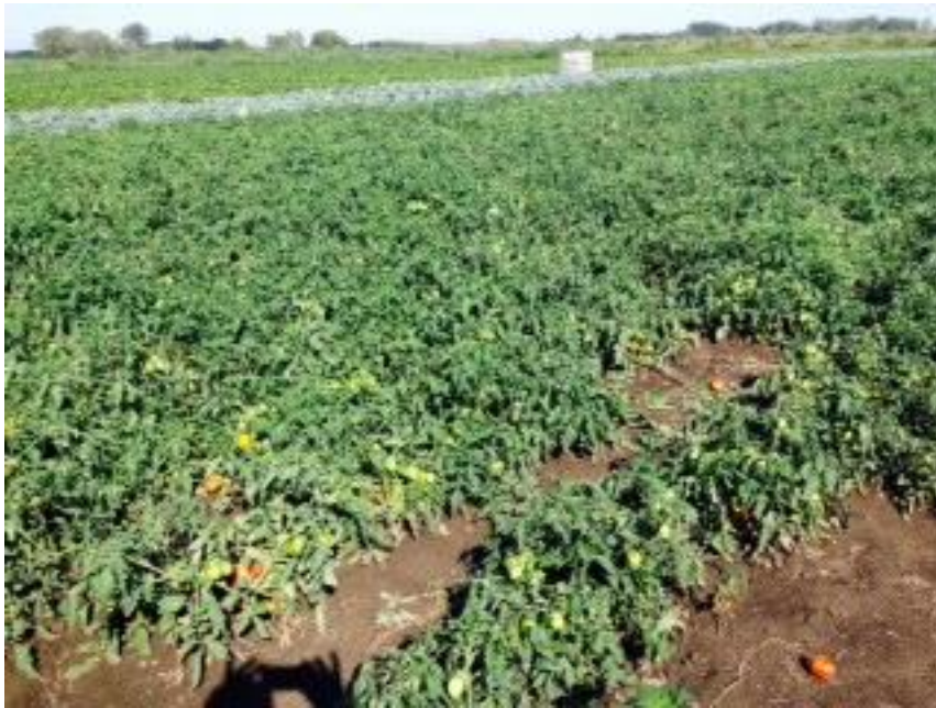
Szabadföldön termelt paradicsom.