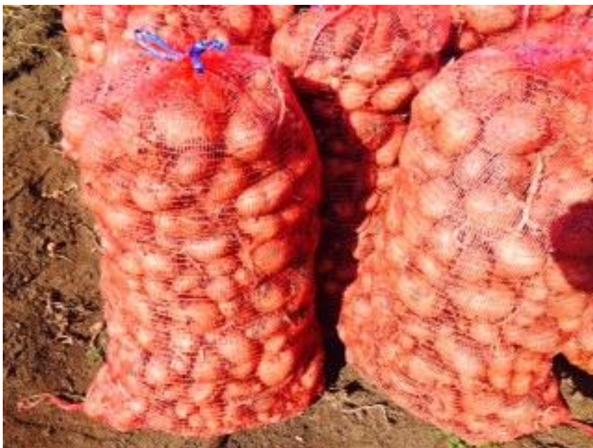
A felszedett burgonya.