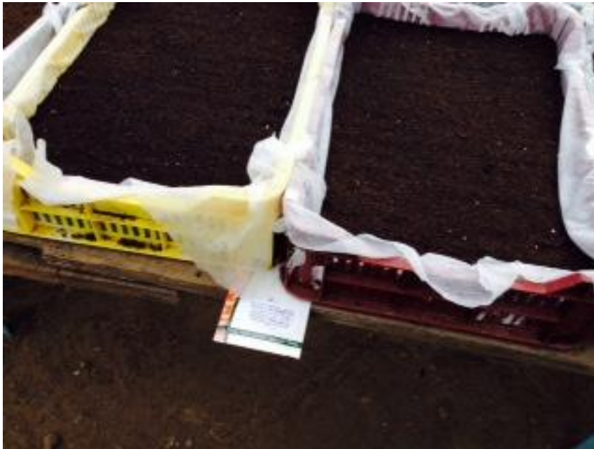
Az uborka magok elvetésre kerültek.